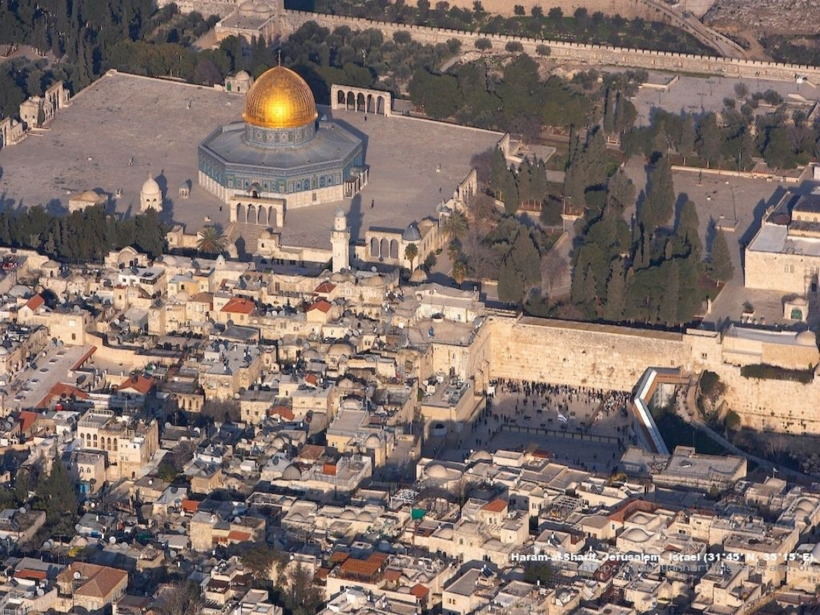
Haram al-Sharif, Jerusalem, Israel (31°45' N, 35°15' E) http://www.gannart.net/ifa/and.org