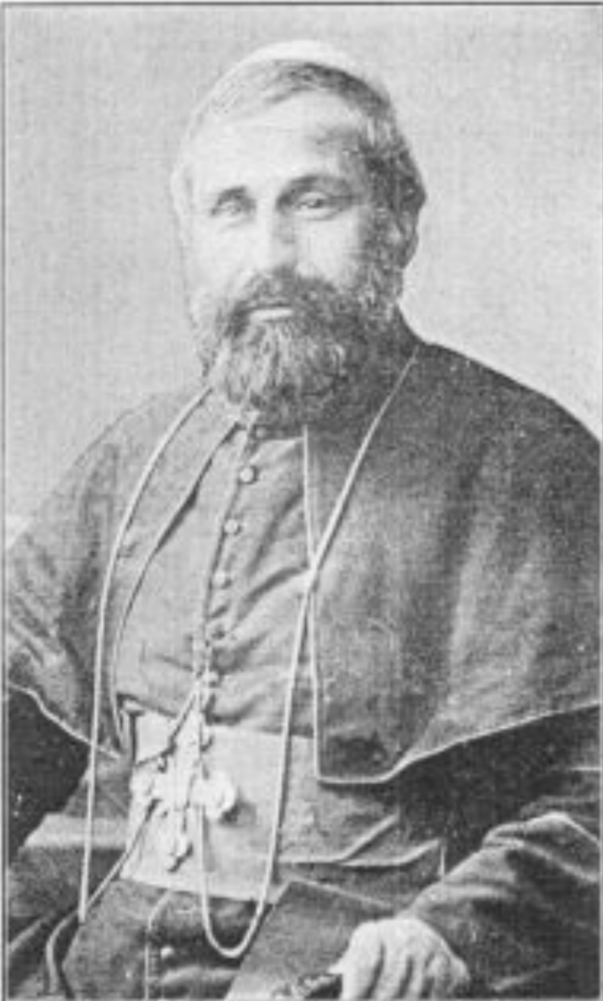
Addai Scher, Chaldean Archbishop of Seert, killed in 1915