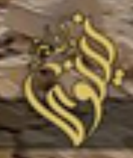
Monastery of Mar Behnam, Iraq, March 2015

تفجير الحسينيات والمراقد الشركية في منطقة الحمدانية