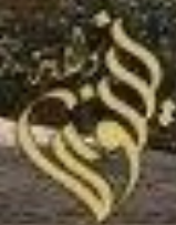
Monastery of Mar Behnam, Iraq, March 2015

تفجير الحسينيات والمراقد الشركية في منطقة الحمدانية