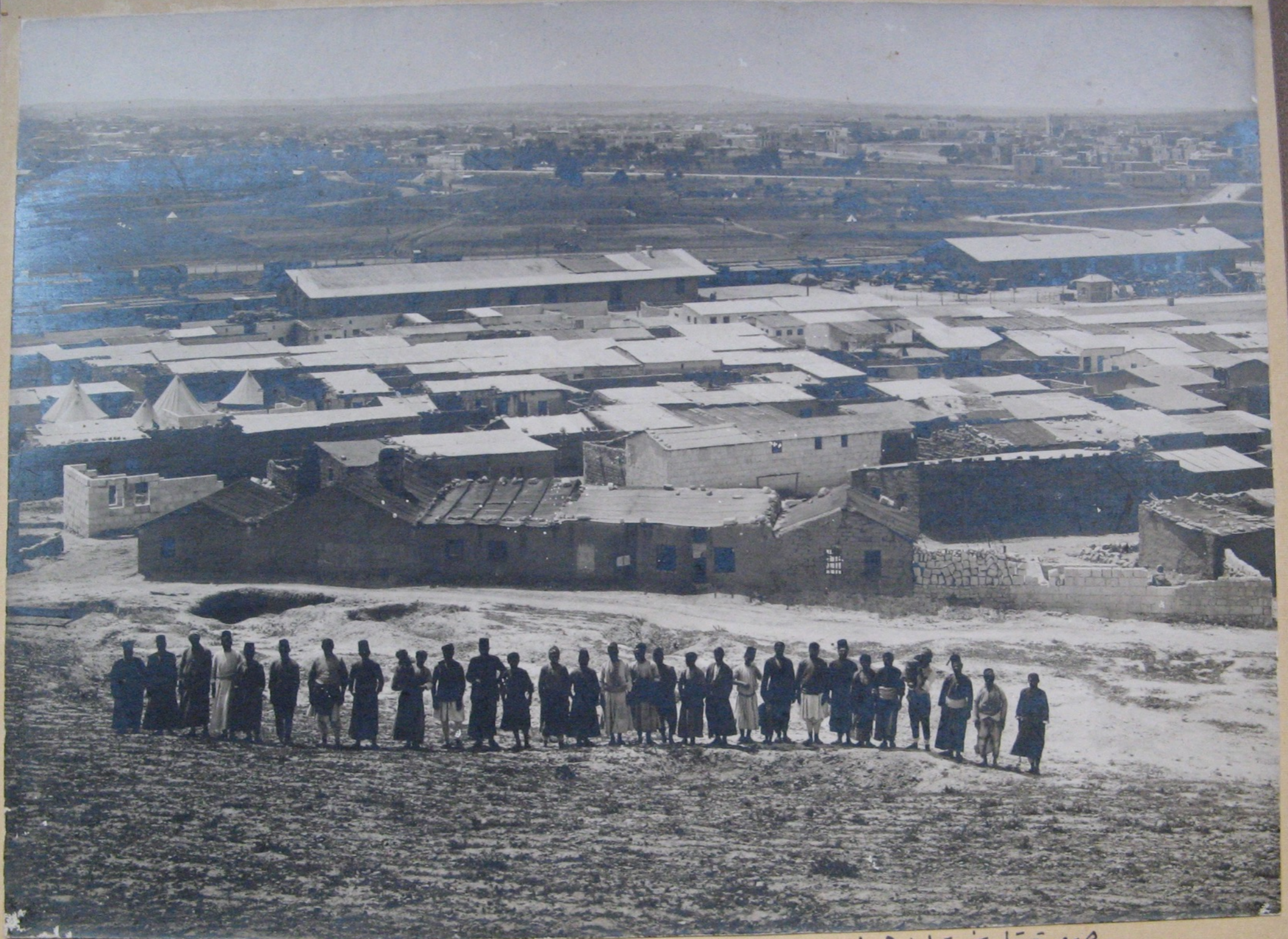
صورة تاريخية ل: هي إسران ، حيث سكن إسران الرهاويون بعد هجرتهم . عام ١٨٢٥ م

معلمنا السيد و معه من أهله و المالكة به كسك : أماد و أماد سعد و معه من أهله و معه من أهله و معه من أهله